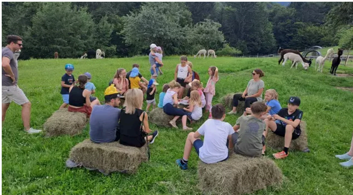
Vorlesen geht auch mitten in der Natur - umgeben von Alpakas.

Lesen gehört zum Alltag unserer Gesellschaft, denn wir lesen täglich Anleitungen, Nachrichten, Kochrezepte, Verkehrsschilder oder E-Mails. Doch Bücher zu unserem Vergnügen zu lesen, steht oft nicht mehr auf dem Tagesprogramm unserer Gesellschaft. Dennoch ist Lesen ein grundlegender Pfeiler unserer Kultur, und es kann viel mehr als nur Informationen vermitteln. Daher ist Lesen oder Vorlesen nicht nur für Kinder wichtig, sondern für alle Generationen. Es fördert die Konzentration und stärkt das Erinnerungsvermögen. So hält es ältere Menschen jung und verbindet Generationen durch die gemeinsam verbrachte Zeit und Nähe. Darauf basiert auch das Erfolgsrezept des Steirischen Vorlesetages. Durch das gemeinsame Vorlesen von spannenden Geschichten an teils sehr außergewöhnlichen Vorleseorten wird auch der achte Steirische Vorlesetag wieder zu einem faszinierenden Event quer durch die ganze Steiermark.