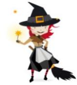
Märchen & Sagen