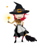
Märchen & Sagen