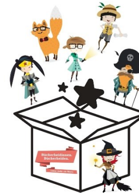
Wer bin ich-Box